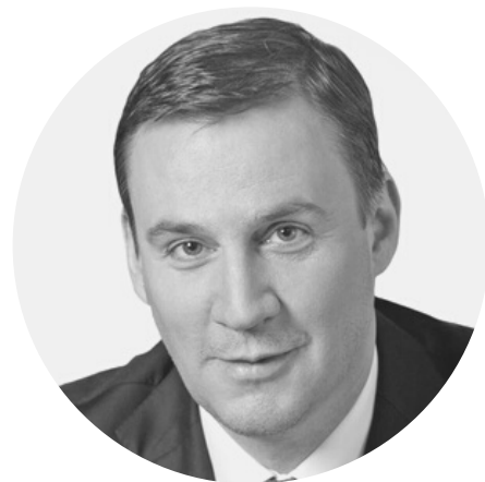
ПАТРУШЕВ ДМИТРИЙ НИКОЛАЕВИЧ Министр сельского хозяйства Российской Федерации