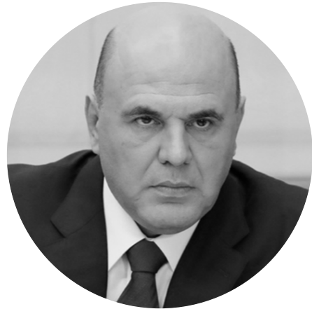
МИШУСТИН МИХАИЛ ВЛАДИМИРОВИЧ

Председатель правительства Российской Федерации