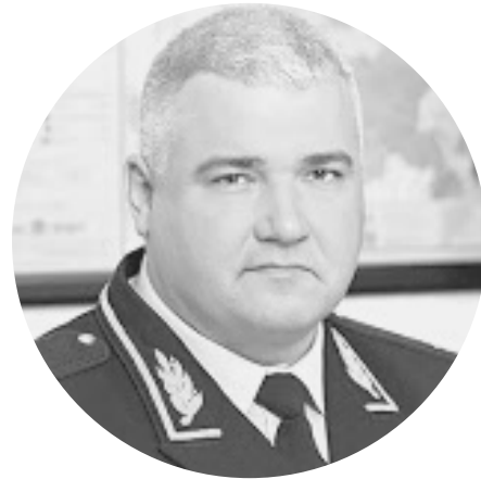
ЧЕРНИКОВ МИХАИЛ ЮРЬЕВИЧ

Заместитель председателя Правительства Российской Федерации