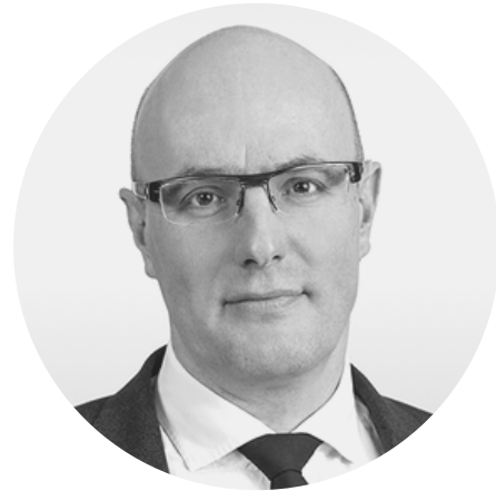
ЧЕРНЫШЕНКО ДМИТРИЙ НИКОЛАЕВИЧ

Председатель правительства Российской Федерации