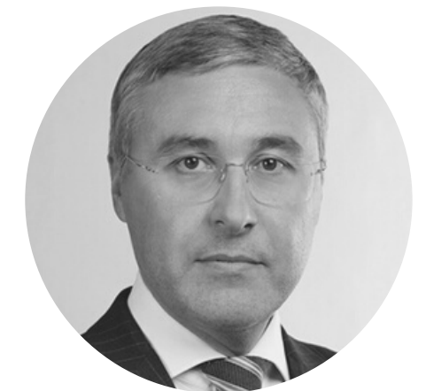
ФАЛЬКОВ ВАЛЕРИЙ НИКОЛАЕВИЧ

Министр науки и высшего образования Российской Федерации