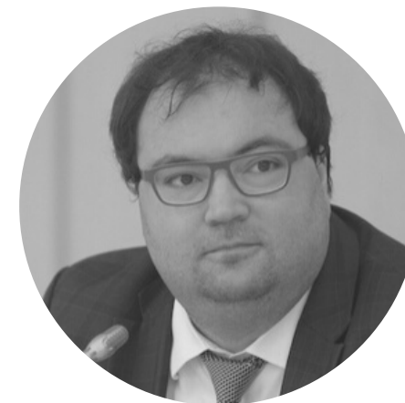
ШАДАЕВ МАКСУТ ИГОРЕВИЧ

Министр цифрового развития, связи и массовых коммуникаций Российской Федерации