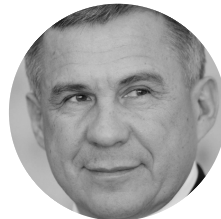
МИННИХАНОВ РУСТАМ НУРГАЛИЕВИЧ

Начальник Главного управления по обеспечению безопасности дорожного движения Министерства внутренних дел Российской Федерации