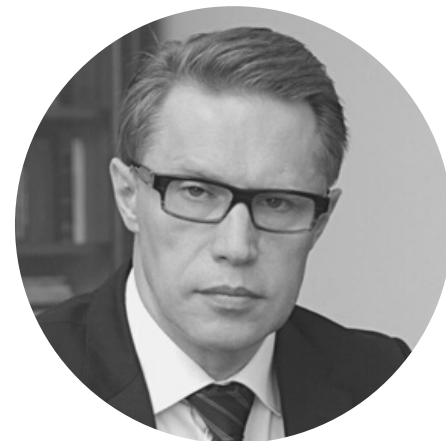
МУРАШКО МИХАИЛ АЛЬБЕРТОВИЧ Министр здравоохранения Российской Федерации