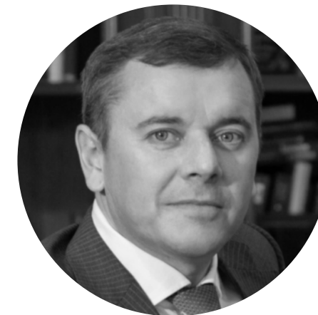
ЗЯББАРОВ МАРАТ АЗАТОВИЧ Заместитель Премьер-министра РТ – Министр сельского хозяйства и продовольствия РТ