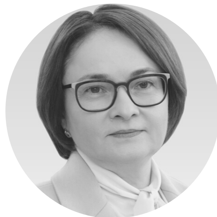
НАБИУЛЛИНА ЭЛЬВИРА САХИПЗАДОВНА