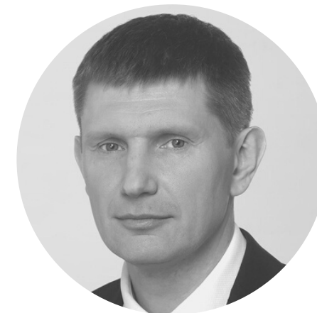
РЕШЕТНИКОВ МАКСИМ ГЕННАДЬЕВИЧ Министр экономического развития Российской Федерации