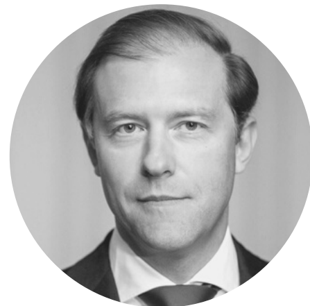
МАНТУРОВ ДЕНИС ВАЛЕНТИНОВИЧ Министр промышленности и торговли Российской Федерации