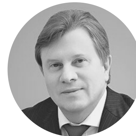
САВЕЛЬЕВ ВИТАЛИЙ ГЕННАДЬЕВИЧ

Министр цифрового развития, связи и массовых коммуникаций Российской Федерации