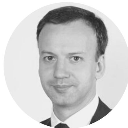
ДВОРКОВИЧ АРКАДИЙ ВЛАДИМИРОВИЧ