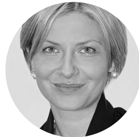
ГАТАГОВА ОЛЬГА АНАТОЛЬЕВНА Заместитель министра сельского хозяйства Российской Федерации