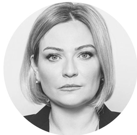
ЛЮБИМОВА ОЛЬГА БОРИСОВНА Министр культуры Российской Федерации